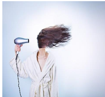
Elle vient de se laver les cheveux.