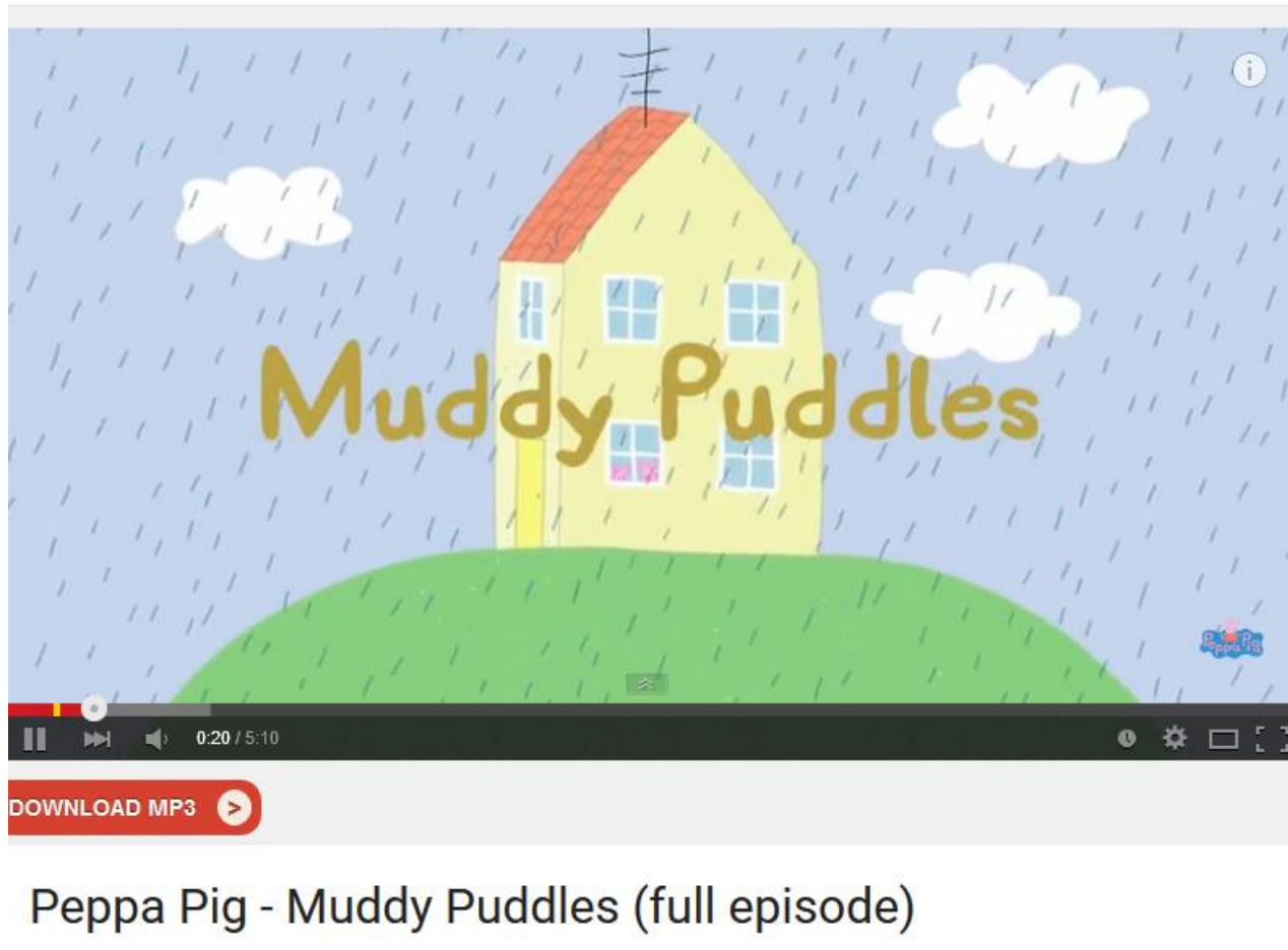
Peppa Pig - Muddy Puddles (full episode)

https://www.youtube.com/watch?v=UgA0wI1hjOk