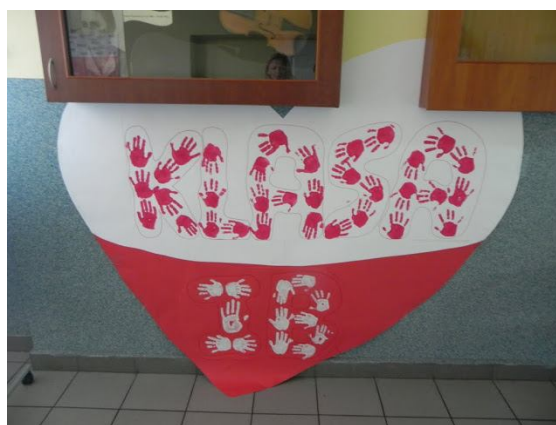
Prace przygotowane przez uczniów klasy I i II szkoły podstawowej

Przygotowane przez uczniów materiały stały się elementem dekoracji szkolnej uroczystości, która w tym roku przybrała radosną formę happeningu patriotycznego i bardziej przypominała imprezę urodzinową niż poważne święto narodowe.