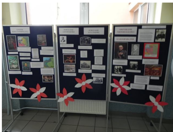
Wystawa historyczna „ Polska droga do niepodległości”

zachęcające do udziału w imprezie, informujące o czekających na jej uczestników atrakcjach i przypominające o odpowiednim do okazji stroju. Aby umożliwić uczniom lepsze poznanie „Ojczyzny – Jubilatki”, przygotowana również została wystawa historyczna, która prezentowała jej dzieje od czasów rozbiorów aż po pamiętny rok 1918, kiedy, po 123 latach niewoli, Polska odrodziła się ponownie.