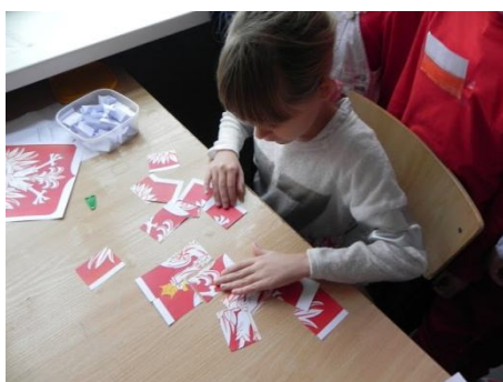
Puzzle – Godło Polski

stanowiska konkursowe: odrębne dla uczniów klas I–III i klas IV–VI szkoły podstawowej oraz dla gimnazjalistów. Każda poprawnie udzielona odpowiedź, właściwie rozwiązane zadanie nagradzane było słodkim upominkiem, co z pewnością znacznie podniosło atrakcyjność konkursów. W ramach happeningu uczniowie mogli ponadto odwiedzić punkt malowania twarzy – paleta kolorów ograniczała się oczywiście do barw narodowych – oraz stoisko formowania z balonów białych i czerwonych zwierzątek.