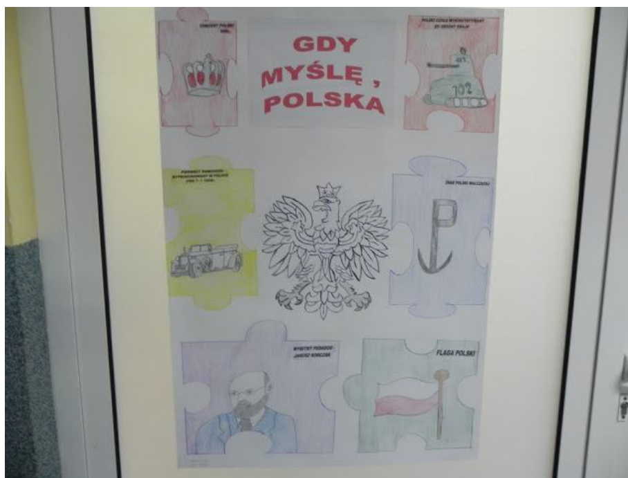
Praca plastyczna przygotowana przez uczniów klasy V szkoły podstawowej

Szkolne korytarze udekorowane zostały biało-czerwonymi balonami, z głośników płynęła muzyka patriotyczna, a na „gości” czekały liczne konkursy. Formę zaproszenia urodzinowego pełnić miały rozwieszone wcześniej plakaty