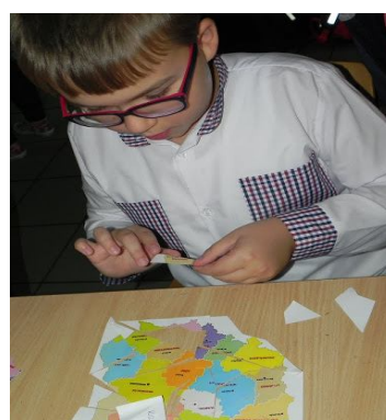
Puzzle – Podział administracyjny Polski