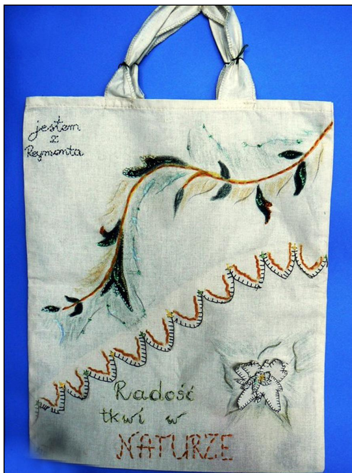
Uczniowski projekt ekotorby