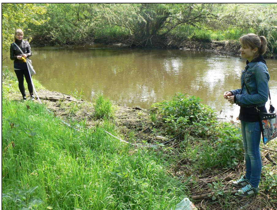
Uczniowie prowadzą badania na ścieżce dydaktyczno-badawczej Jaskrów – Częstochowa

W roku szkolnym 2010/2011 uczestniczyliśmy jako szkoła współpracująca w projekcie realizowanym przez ZS im. C.K. Norwida „Regionalne projekty badawcze GLOBE”. Ścieżka dydaktyczno-badawcza „Wpływ regulacji koryta rzeki Warty na odcinku Jaskrów – Mirów na różnorodność roślinności przybrzeżnej ze szczególnym uwzględnieniem drzew i krzewów” była opisana w „Częstochowskim Biuletynie Oświatowym” nr 3/2011.