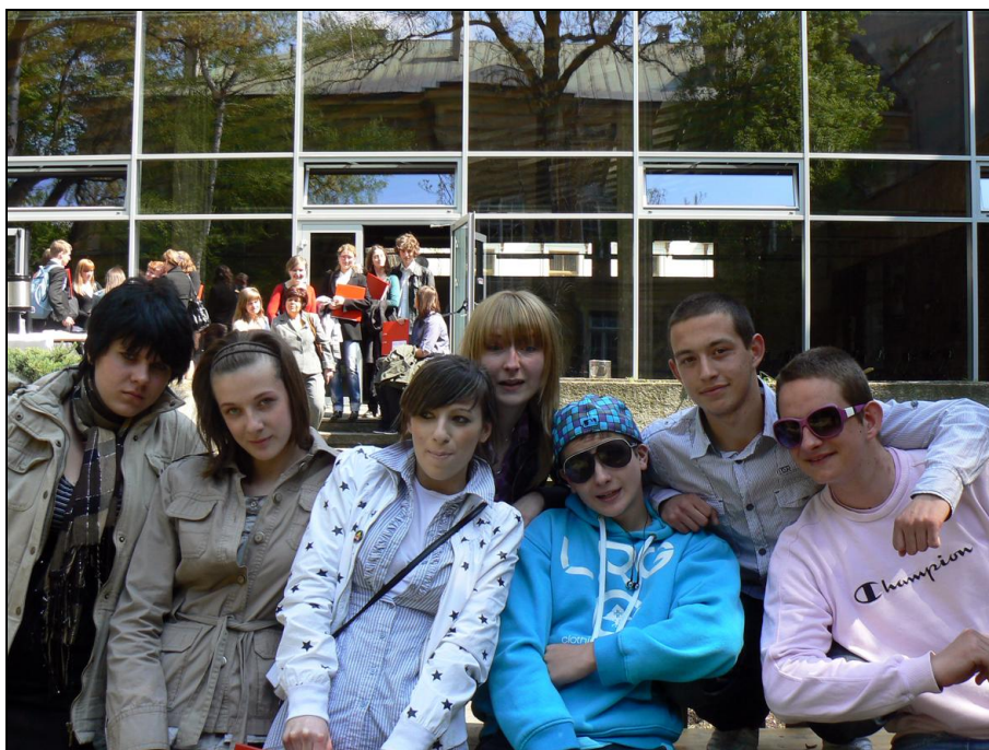
Zespół redakcyjny Ekomodnych po ogłoszeniu wyników konkursu na szkolny portal medialny