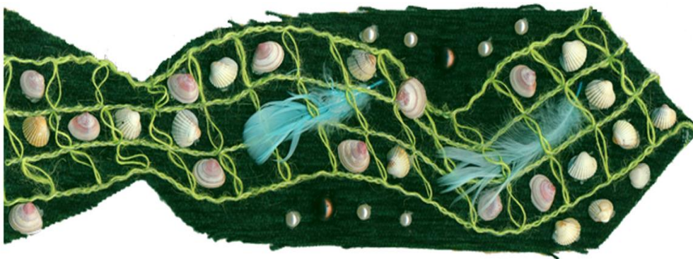
Projekt krawata z przyrodniczym motywem dekoracyjnym