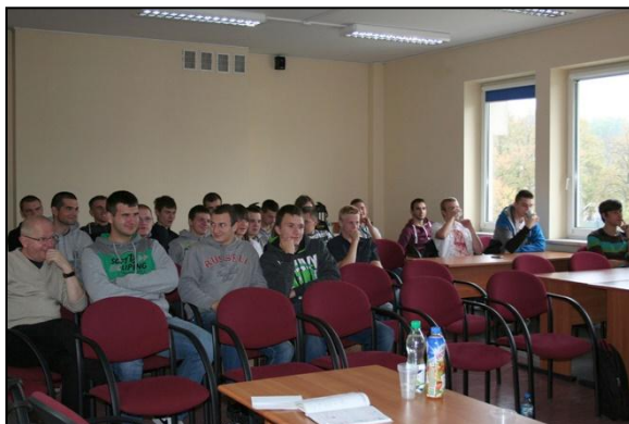
Publiczność – klasa IV z Technicznych Zakładów Naukowych

Debatantom przysłuchiwała się klasa IV z Technicznych Zakładów Naukowych.