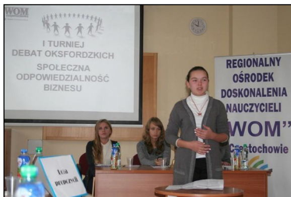
Debata – argumenty opozycji

Debatanci poruszali bardzo ważne aspekty funkcjonowania kodeksu etycznego w przedsiębiorstwach. Zastanawiali się, na ile kodeks etyczny jest rzeczywiście potrzebny w biznesie, a na ile wpływa on z potrzeby PR.