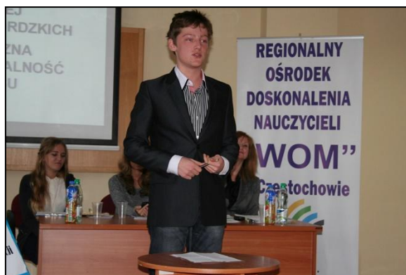
Debata – argumenty propozycji

Poruszono m.in. takie zagadnienia jak: GMO, zdrowa żywność, marketing i finanse.