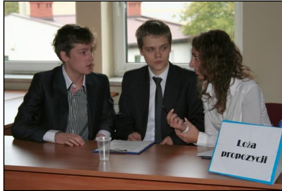
Łoża propozycji – ISLO Częstochowa

Następny etap turnieju będzie miał miejsce 16.10.2013 r. już w Katowicach. Zwycięskie drużyny spotkają się w finale debaty 30.10.2013 r. w Sali Sejmiku Śląskiego. Z każdym etapem rośnie trudność tematyczna. I tak w II etapie drużyny będą musiały zmierzyć się z tematem Idea Sprawiedliwego Handlu to utopia, natomiast temat finałowy to: Węgiel kamienny – więcej korzyści niż problemów dla Polski.